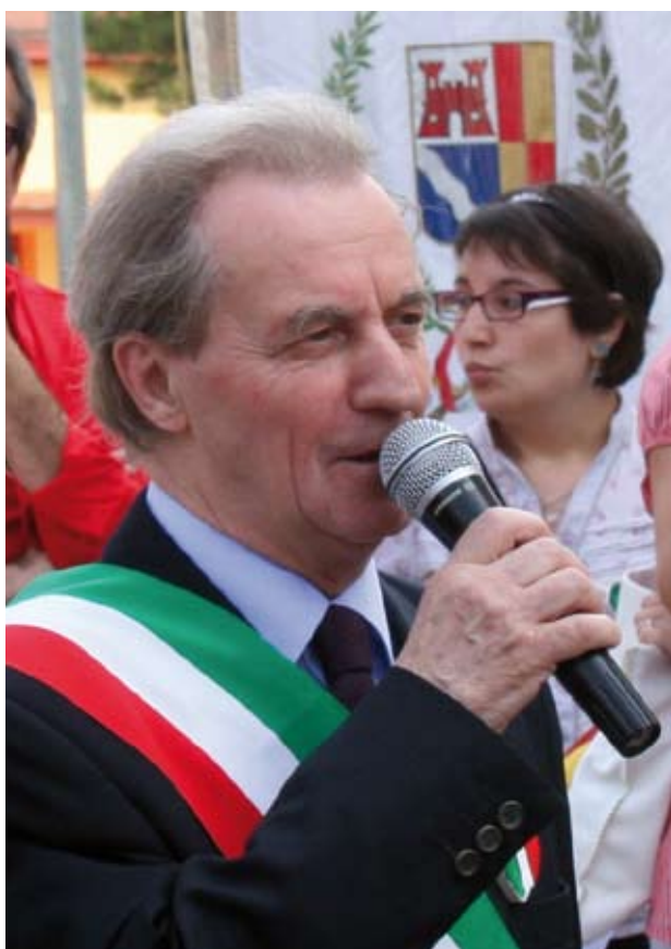
Claudio Soldi, Sindaco di Cingia de' Botti